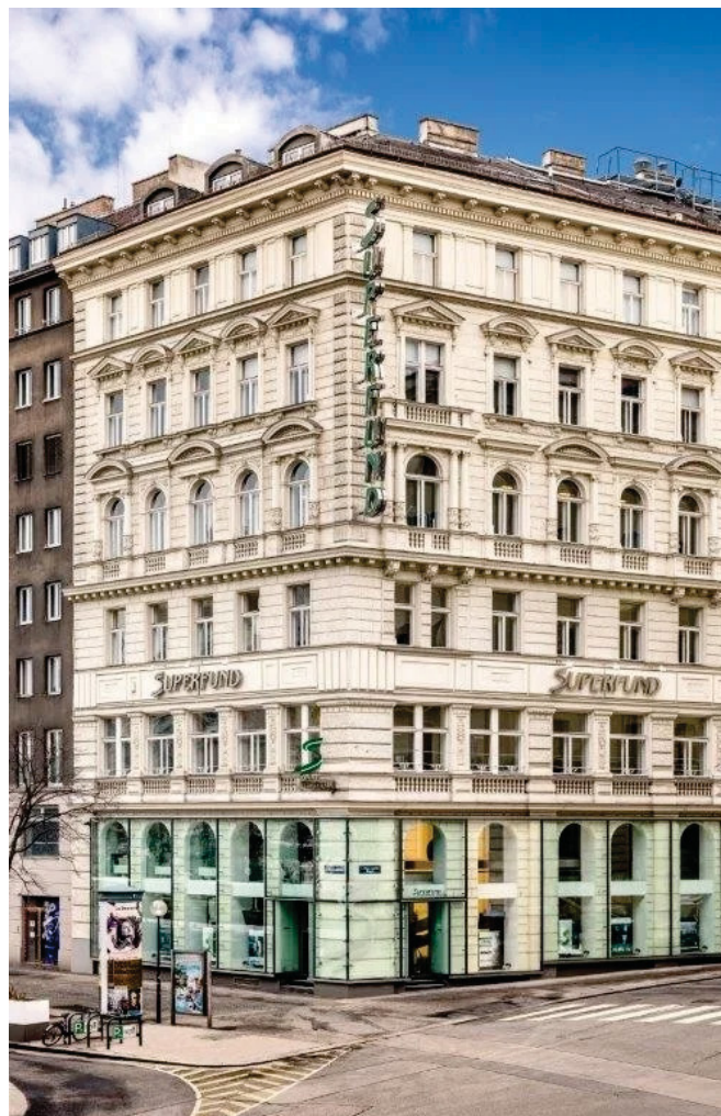
オーストリア・ウィーン本社

2005年東京にオフィスを開設し、日本市場でも信頼される投資先として成長し、おかげさまで本年で20周年を迎えました。